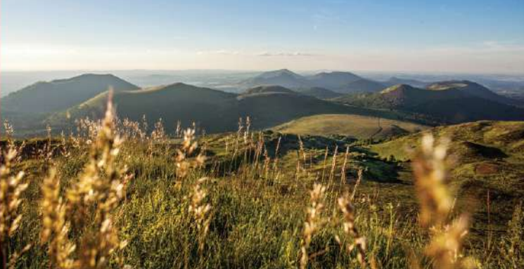
Sommet du puy de Dôme (1 465 m)

CHÂNE DES PUYs - FAILLE DE LIMAGNE PATRIMOINE MONDIAL DE L'UNESCO UN HAUT LIEU TECTONIQUE INSCRIT SUR LA LISTE DU PATRIMOINE MONDIAL DE L'UNESCO Ce territoire préservé au cœur du Massif central est une terre d'exception pour apprendre et découvrir en famille, pratiquer des activités de pleine nature ou se ressourcer au contact de paysages majestueux. Paysage emblématique des volcans d'Auvergne avec ses 80 volcans aux formes variées, l'ensemble Chaîne des Puys - faille de Limagne est un observatoire incomparable des phénomènes géologiques liés à la rupture d'un continent. • D'INFOS : www.chainedespuys-failladelimagne.com