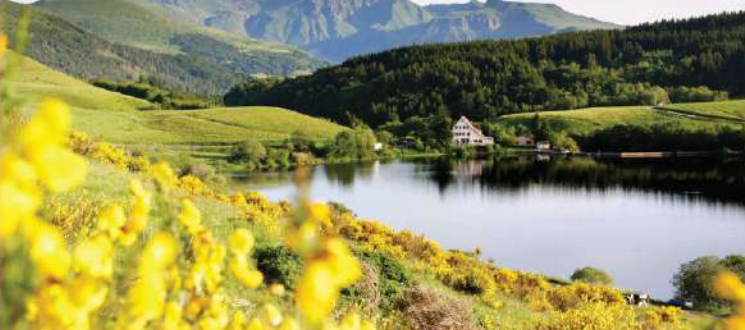
Chaîne des Puys

MARCHE PLUSIEURS JOURS LE LONG DES BOULES ITINÉRANTES : • La boucle des Dômes est balisée, au travers des volcans de la Chaîne des Puys, sur des versions de 49 ou 62 km réalisables entre 2 et 5 jours. • Le tour des Vaches rouges offre, sur 8 à 11 jours de marche, un périple sur les hauts plateaux préservés du Cézallier, entre monts du Cantal et massif du Sancy. • Le tour du pays de Cuzat parcourt rivières et sous-bois typiques du Livradois le temps d'un week-end sur une trentaine de km. • Quant au grand tour entre Puys et Couze sur Champagny, sur la même distance, il est rythmé par la découverte du patrimoine et du terroir de ce charmant village.