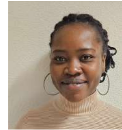
FLORA ADJOGLOE Digital / APIDAE