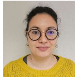
MARIE DULHOSTE Presse / Plan média